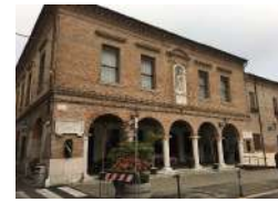
Municipio di Lendinara