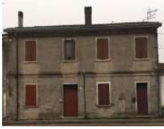
Municipio di Sagedo