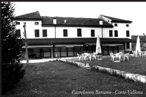
Castelnovo Bariano - Cortè Vallona