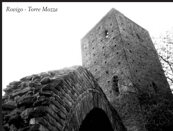
Rovigo - Torre Mozza