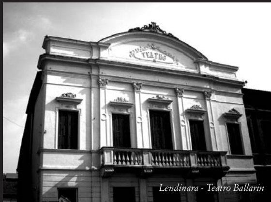
Lendinara - Teatro Ballarin