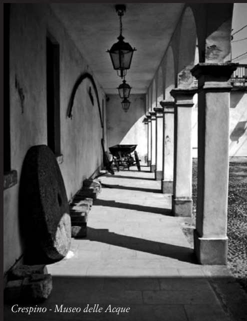
Crespino - Museo delle Acque